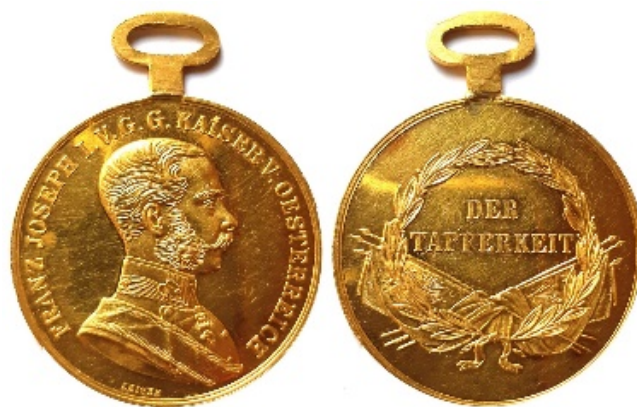
4. kép: Argay Zsigmond eredeti Arany Vitézségi Érme.

kitüntetését magát – egy ún. „T-füles”, 1866-os típusú Arany Vitézségi Érmét 61 – azonban csak bő egy évvel később tűzhetette a mellére Argay Zsigmond.