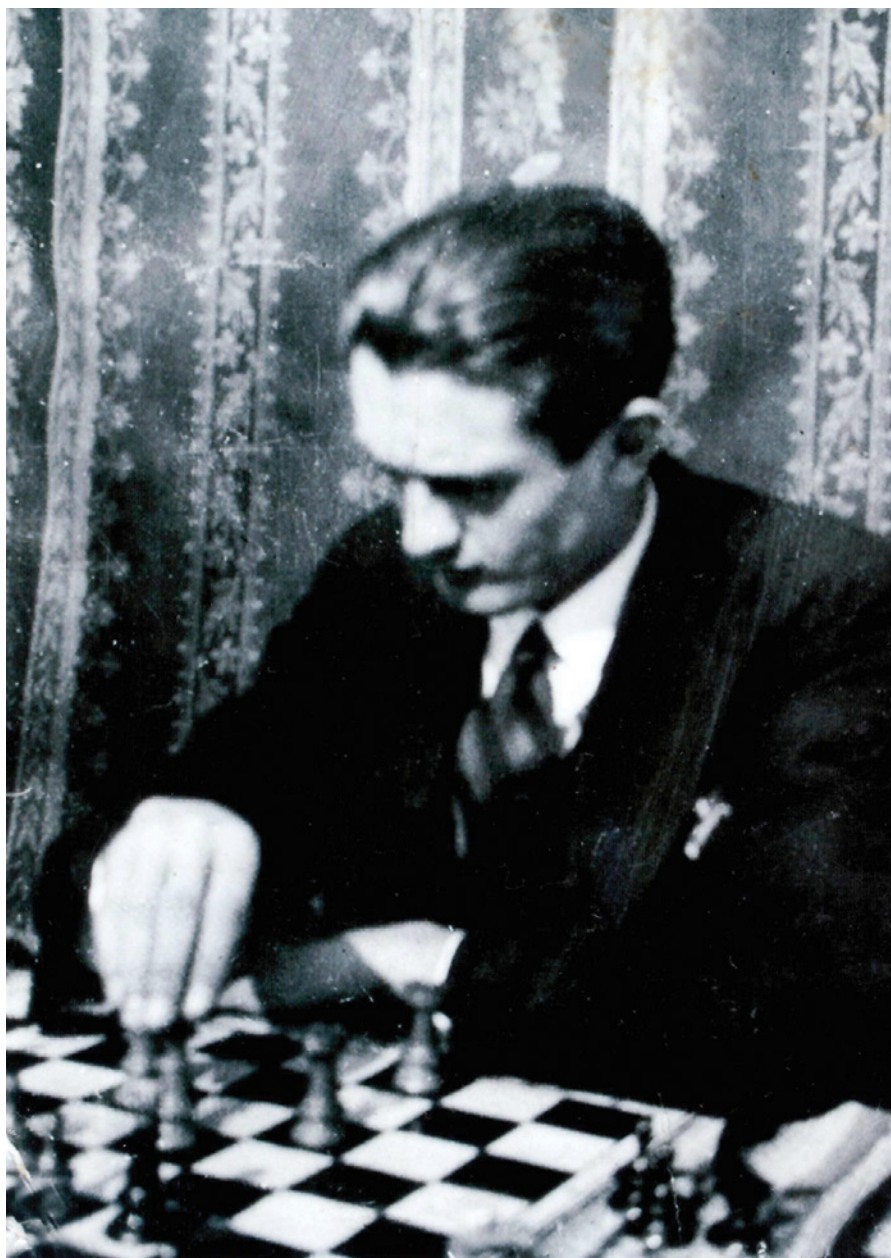
Még itthon 1945 körül...