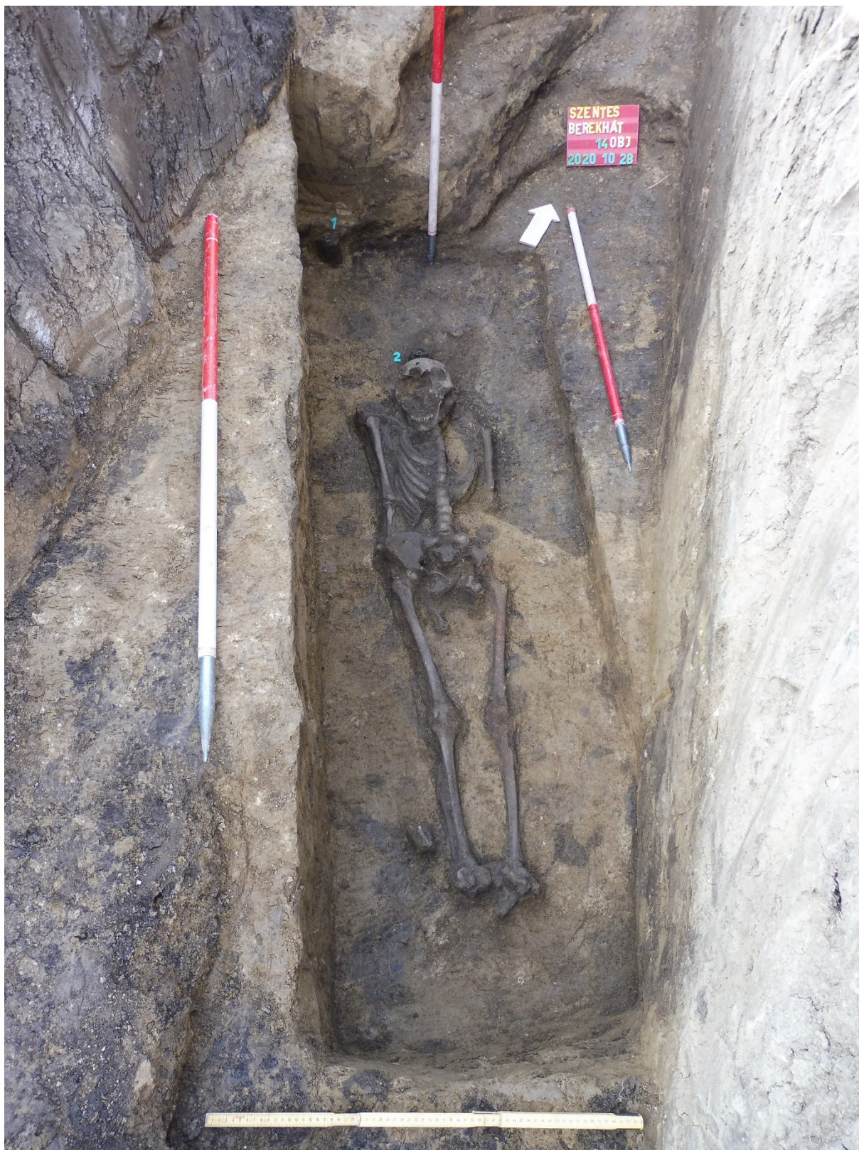
4. kép: A 14. sír

A 12. sírban nyugvó férfit öntött bronzveretekkel díszített övgarnitúrával indították utolsó útjára.