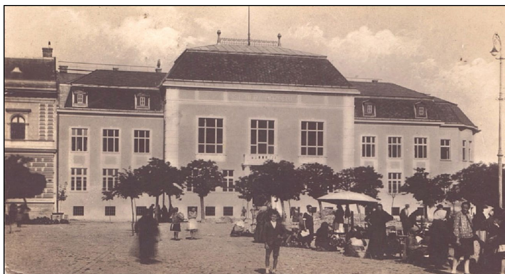
A piac az iskola előtt volt az 1930-as években

Először hatosztályos népiskola volt a református iskola úgy, hogy a negyedik osztály elvégzésével, a középiskolába lehetett átlépni. Az elemi iskolába azok jártak tovább, akik tankötelesek voltak még, de középiskolába vagy nem akartak, vagy nem voltak képesek járni. Tíz éves koruk után a középiskolába nem járók nagyon kevesen végeztek további osztályokat. Ezért pl. a lánytagozaton sokáig csak öt osztály működött. 1940 után nyolcosztályos népiskola szerveződött úgy, hogy a felsőbb osztályosok szorgalmi ideje a mezőgazdasági munkához igazodott, így nem tíz, hanem kevesebb hónapig tartott. Az ekkor bevezetett hetedik és nyolcadik évfolyam annyira néptelen volt, hogy csak a téli hónapokban tudták működtetni.