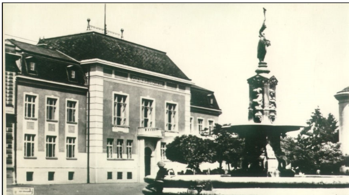
Az 1930-as években a főtéri kútról vezették be a vizet az iskolába

Először hatosztályos népiskola volt a református iskola úgy, hogy a negyedik osztály elvégzésével, a középiskolába lehetett átlépni. Az elemi iskolába azok jártak tovább, akik tankötelesek voltak még, de középiskolába vagy nem akartak, vagy nem voltak képesek járni. Tíz éves koruk után a középiskolába nem járók nagyon kevesen végeztek további osztályokat. Ezért pl. a lánytagozaton sokáig csak öt osztály működött. 1940 után nyolcosztályos népiskola szerveződött úgy, hogy a felsőbb osztályosok szorgalmi ideje a mezőgazdasági munkához igazodott, így nem tíz, hanem kevesebb hónapig tartott. Az ekkor bevezetett hetedik és nyolcadik évfolyam annyira néptelen volt, hogy csak a téli hónapokban tudták működtetni.