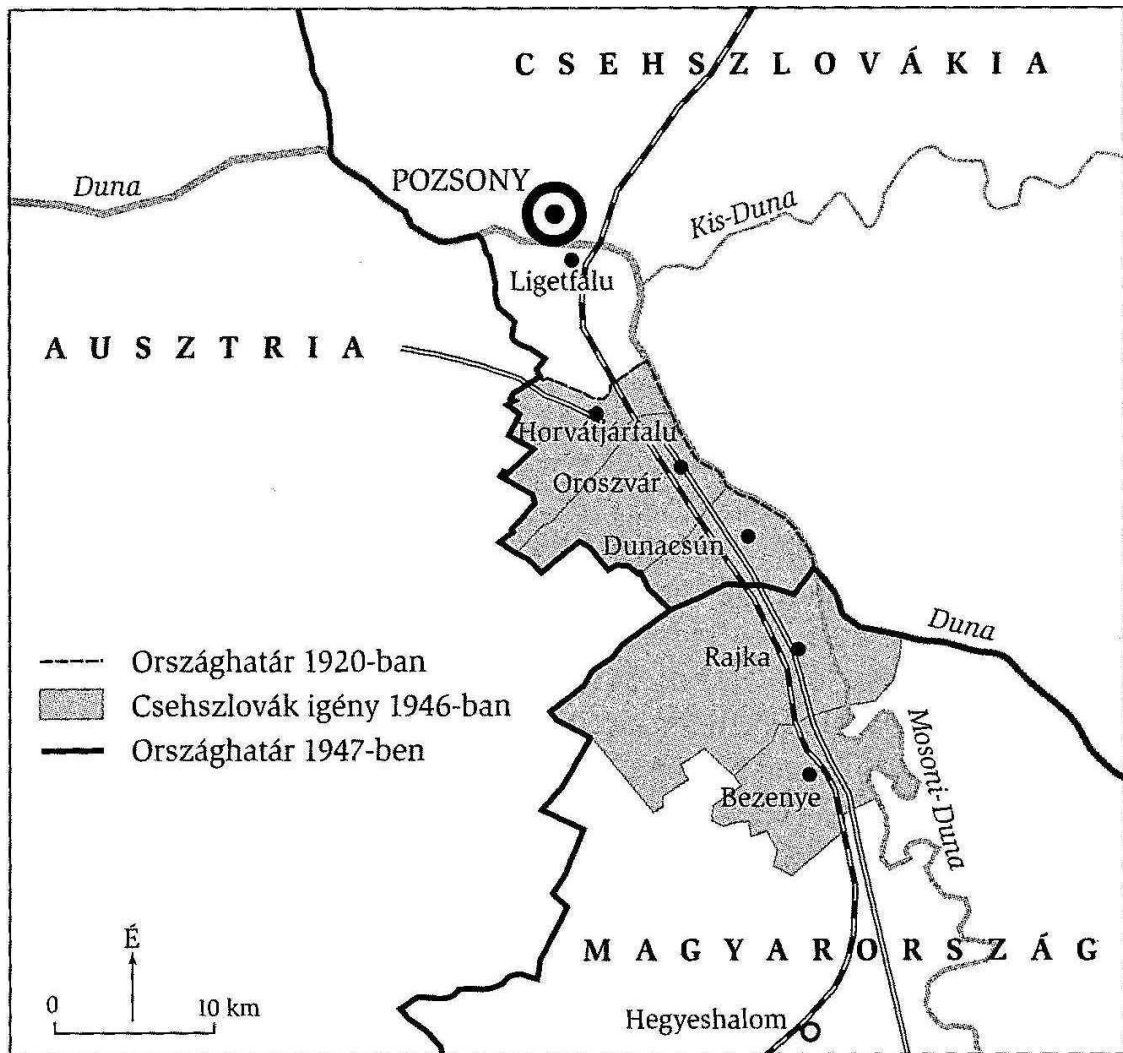
3. kép A pozsonyi hídfő.