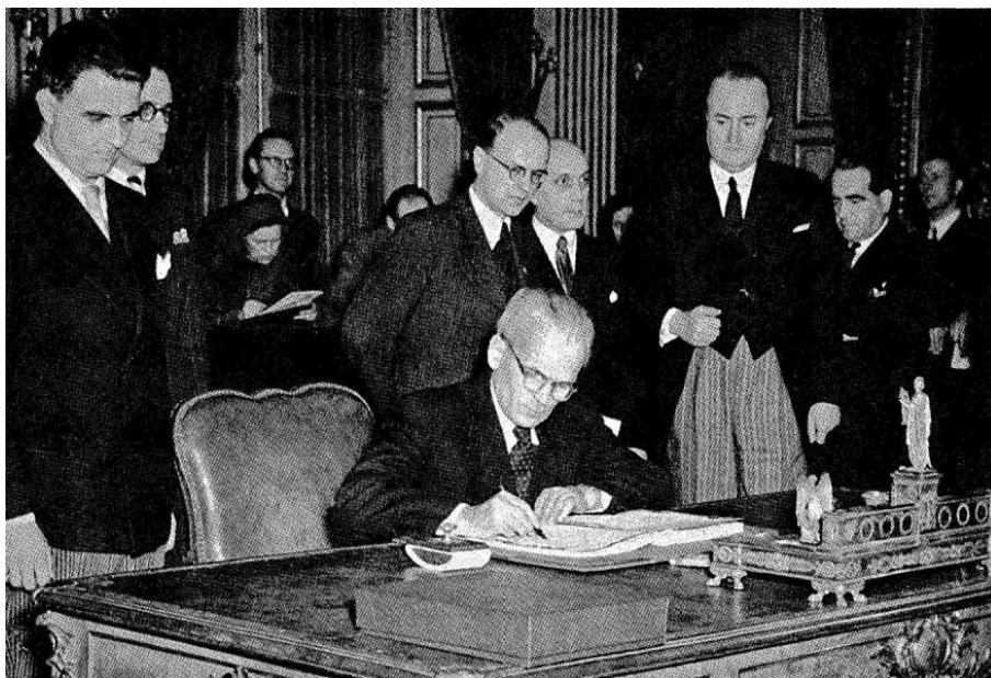
4. kép Gyöngyösi János aláírja a békeszerződést Párizsban.