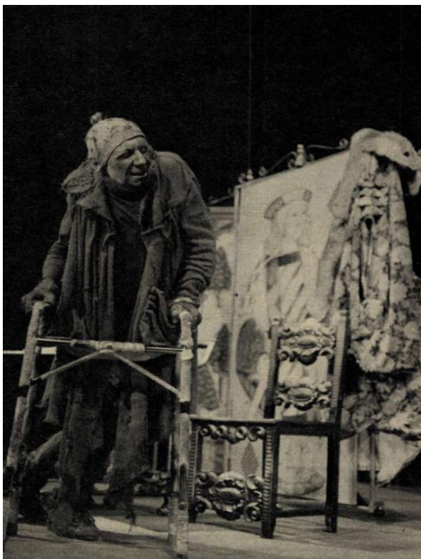
11. kép Utolsó filmjében a Hány az óra, Vekker úr?-ban.