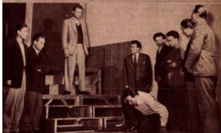
A színész főtanács III. évfolyama az »Antigone«-ból próbál egy jelenetet