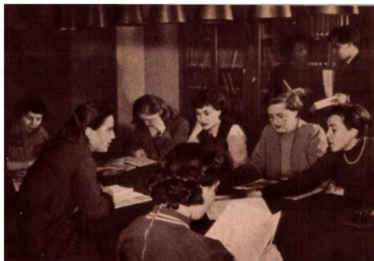
A fiatal dramaturgjelöltek sűrűn igénybe veszik a Főiskola jól felszerelt könyvtárát