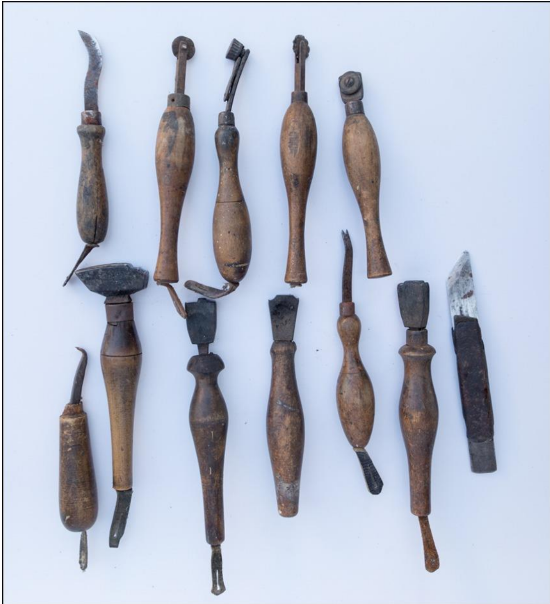
15. ábra Kéziszerszámok: csusznájp, vócvágók, rádlik, ampsz, snittvasak, kneipkés (dikics)

A munkaasztal felett, a fa ablakpárkányba vert szögeken függtek nyelükre erősített bőrhurkokkal felakasztva a gyakran használatos kisebb kéziszerszámok, összesen 12 darab: , 1 nyeles kés (csusznájp), a talpbélés kivágására, 4 különböző vócvágó, melyek bőrcsíkvágásra, illetve a ráma szélének simára vágására szolgáltak, 1 bindolóár, a felsőrész és a talpbélés összeerősítéséhez, 1 ampsz, viaszozás bőrré sütésére, 2 snittvas, viaszozás bőrré