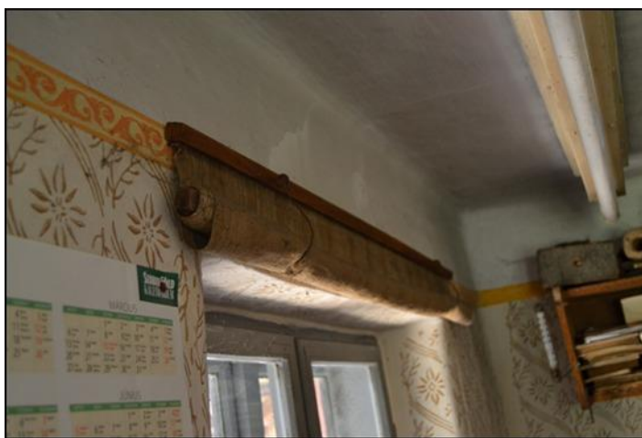
6. ábra A függöny

Az ablakot durva anyagú vászonfüggönnyel lehetett elsötétíteni. A fehérre meszelt falakra díszítésül festőhengerrel