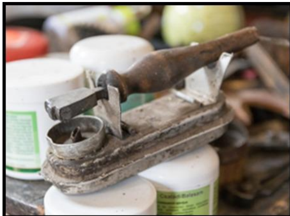
17. ábra Snittvas a viaszmelegítőn

- 3 darab csípőfogó és harapófogó , a felsőrészt a talpbéléshez erősítő fa cvekkszegek kihúzására