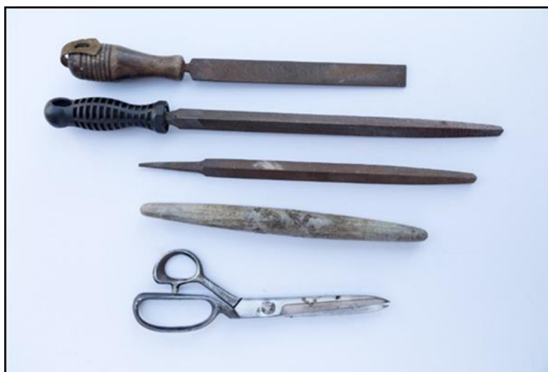
18. ábra vócvágók, bindoló- és szegzőárok. Ráspolyok, fenőkő és szabóolló

Az eredeti épület áttelepítése anyagi korlátok miatt nem kerülhet szóba. A műhely enteriőrszerű bemutatásának tervezett helyszíne az ópusztaszeri Szabadtéri Néprajzi Gyűjteményben a tömörkényi községháza udvarát övező műhelysor: a borbélyüzlet, a