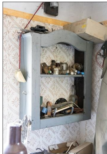
4-5. ábra A műhely belső terei

A műhely deszkapadlójú helyiségben volt kialakítva, amely a bejárat baloldalán lévő ablakon át kapta a fényt.