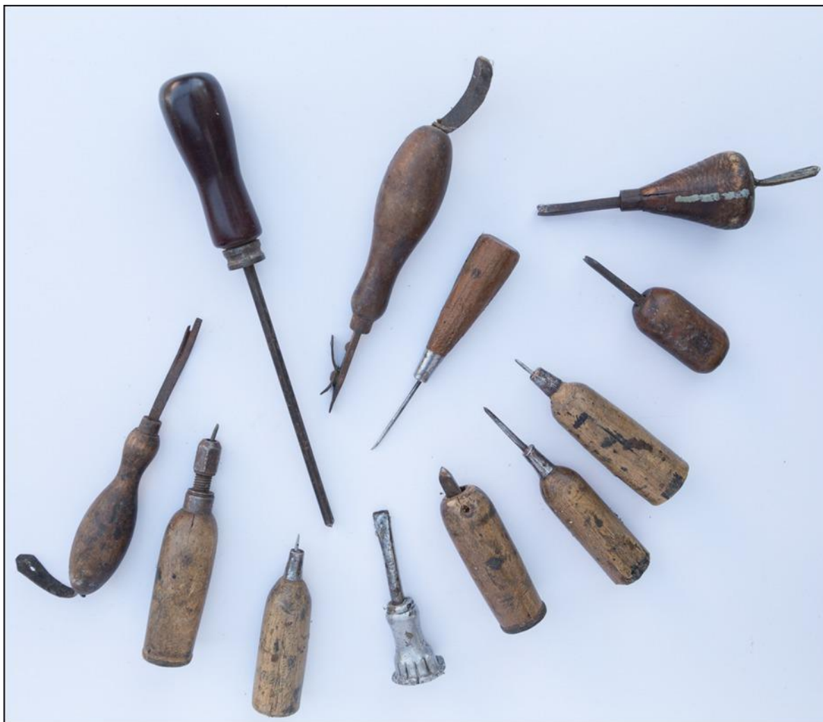
16. ábra vócvágók, bindoló- és szegzőárok. Ráspolyok, fenőkő és szabóolló