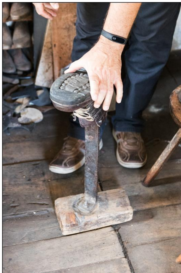
13. ábra Cipészüllő

bevarrásához használt, végén vasborítású kupakkal záródó farúd , és egy fatalpas fém