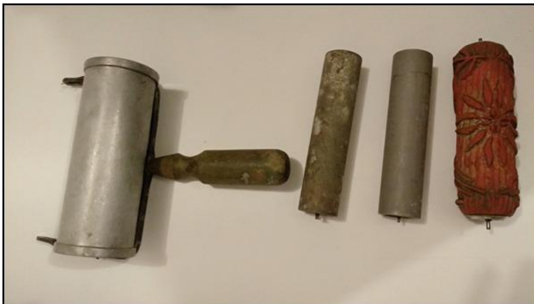
20. ábra A virágmintás falfestés és az eredeti festőhenger

enteriórben Reményeink szerint a kiállítás a cipész háziipar tárgyi emlékeinek bemutatása mellett méltó módon őrzi majd Vincze János emlékét is.