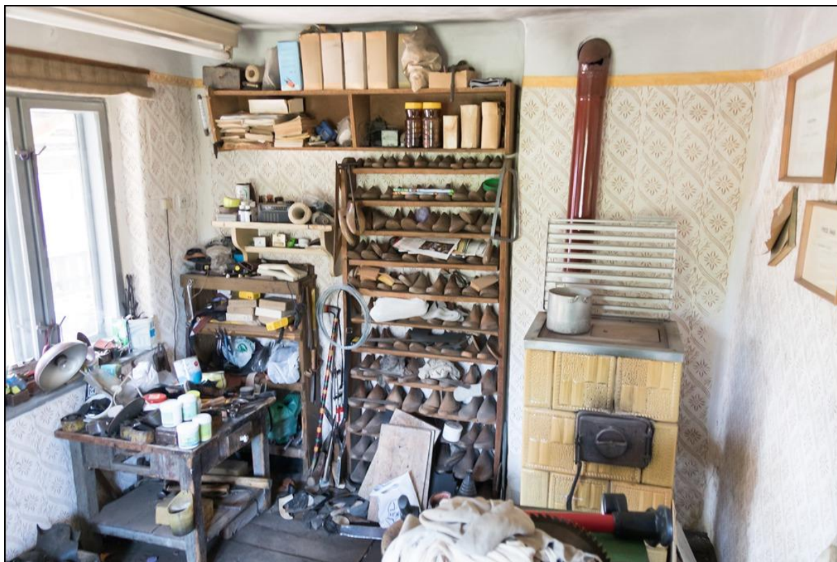
8. ábra A műhely belső terei

A mesternek egy négy lábú és egy három lábú susztárszéke volt. A helyiség bútorai közé tartozott egy faragott lábú, zöld pad és a műhely bejárata mellett balkézről elhelyezkedő munkaasztal (az úgynevezett pangli), egy fiókos, alsópolcos, sötét színűre festett, négyzetes asztal