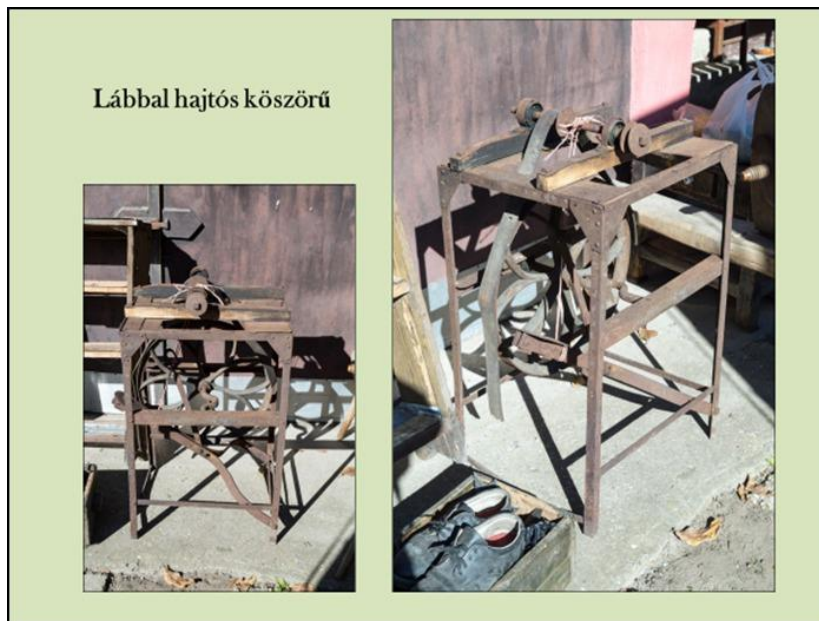
12. ábra Lábbal hajtós köszörű

A hátsó falon függött egy falilámpa mellett két bekeretezett szakmai oklevele.