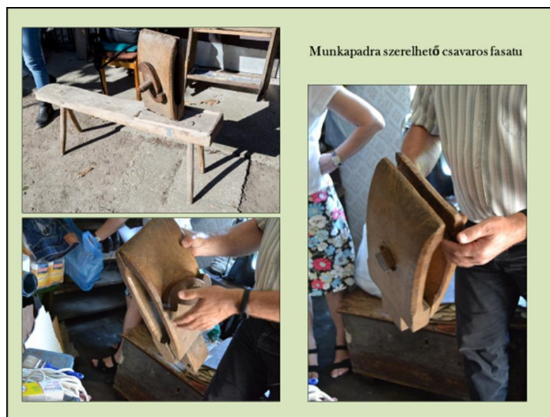
11. ábra Munkapadra szerelhető csavaros fasatu

A hátsó falnál állt egy vasvázás, lábbal hajtós köszörű, egy négy lábú fa munkapad és a