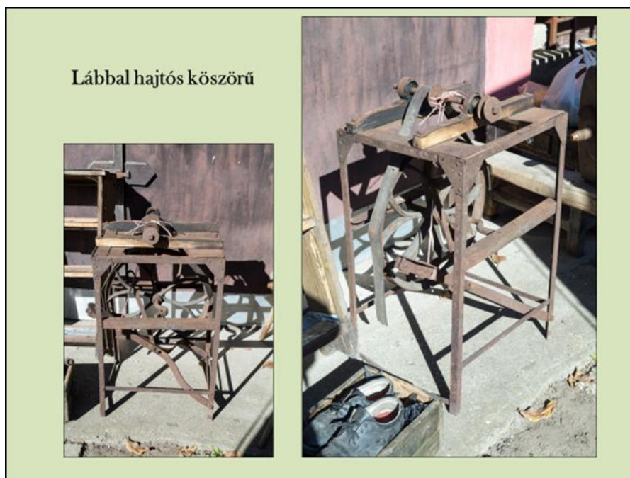
10. ábra Lábbal hajtós köszörű