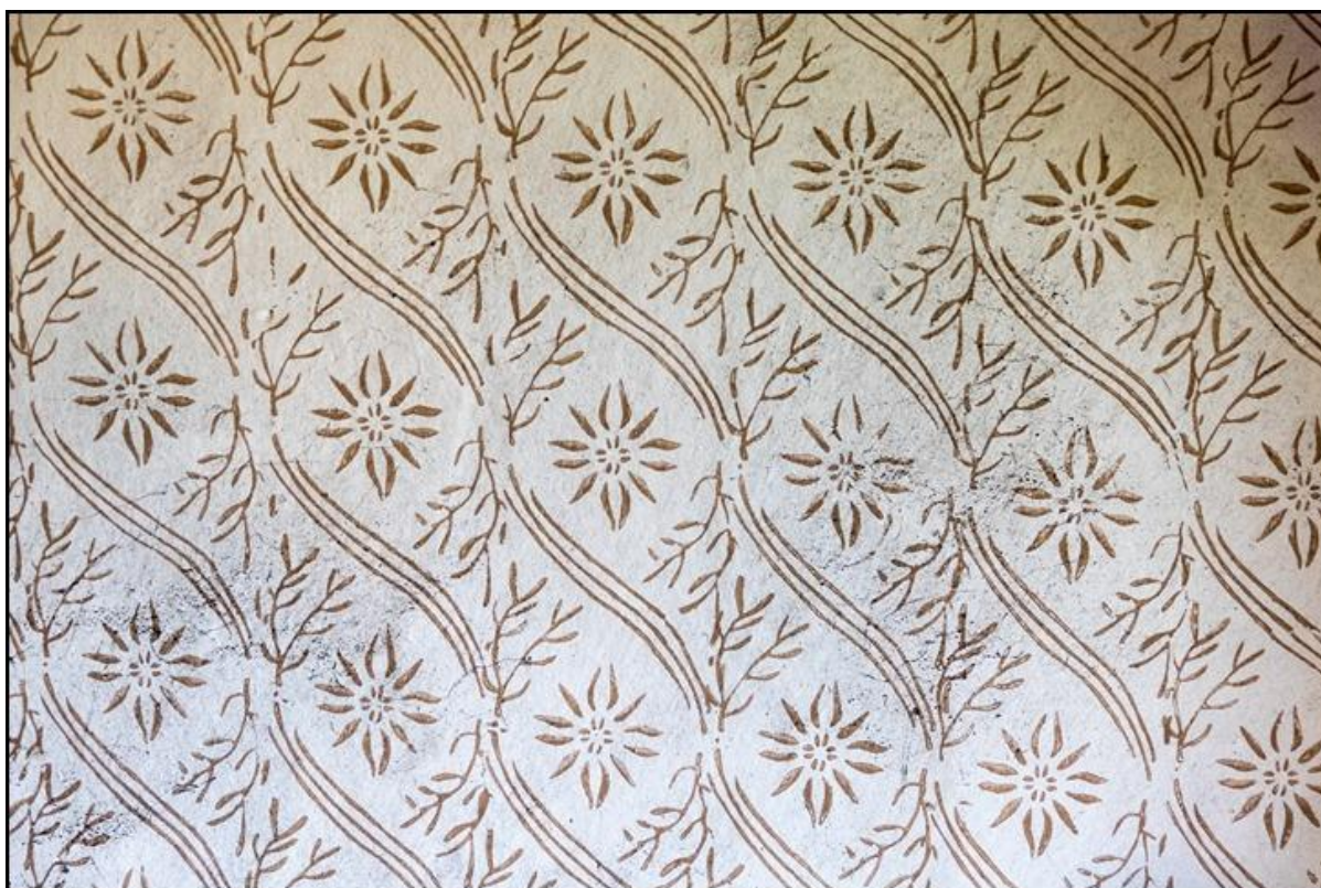
19. ábra A virágmintás falfestés és az eredeti festőhenger

A műhely falának fehér alapon sárga virágmintás díszítését nem csak fotódokumentáción tudtuk megörökíteni, de szerencsére az eredeti festőhengert és mintahengereit is megkaptuk ifjabb Vincze Jánostól, így terveink szerint lehetséges lesz az egykori falfestés teljesen hiteles újraalkotása is az Ópusztaszeren megvalósítani tervezett