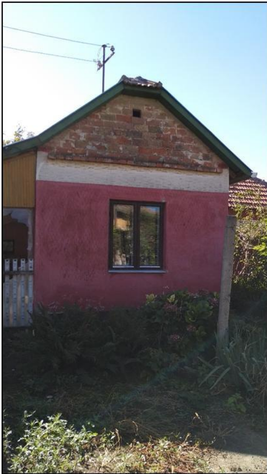
1. ábra. Az eredeti műhelyépület

Nemcsak Szentes környékének, de az egész Dél-Alföldnek egy fontos ipartörténeti emlékegyüttese került így megmentésre. A műhely különálló épülete a Tömörkény, Szabadság utca 28. szám alatti telken található kertes családi ház udvarán helyezkedik el. Egy több évtizeden át működő cipésműhely története tükröződik az eszközökben, a