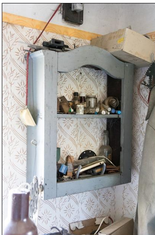
9. ábra A műhely belső terei

A késpengéket egy fémállványos, lábbal hajtós kösörűn fente.