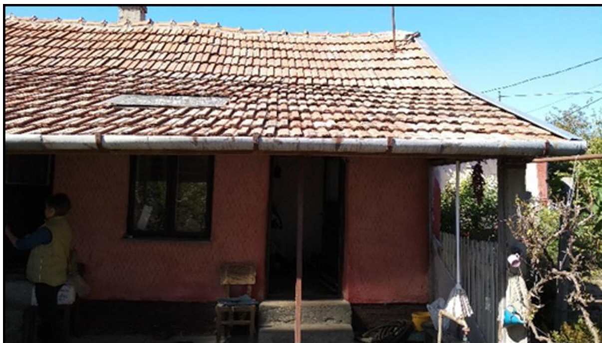
2. ábra Az eredeti műhelyépület