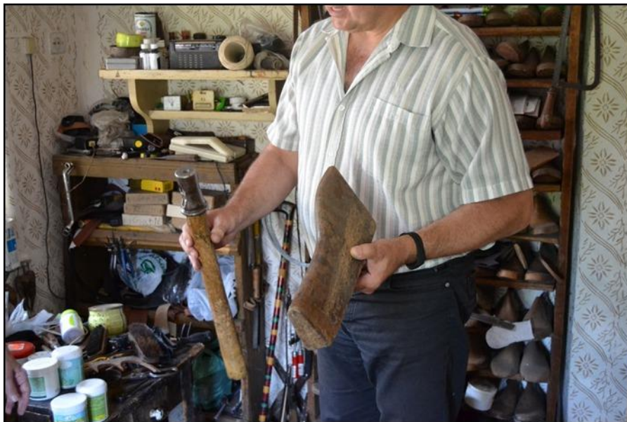
14. ábra . Kloforc

A nagyobb méretű kéziszerszámok közé tartozott a vasalt kloforc , a csizma