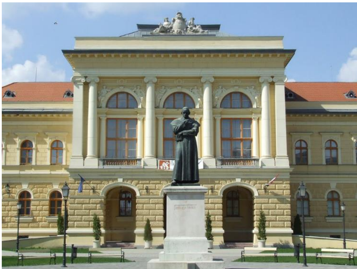
2. ábra Horváth Mihály szobra Szentesen a Kossuth téren, háttérben a Megyeháza épületével

Az emigrációban is folytatta történetírói tevékenységét. Külföldi levéltárakban kutatott és élénk levelezést folytatott emigráns politikustársaival, valamint az otthon maradt ismerőseivel is. Közülük kiemelkedett Toldy Ferenc, aki rendszeresen küldött ki Horváthnak anyagokat és beszámolt neki az aktuális hazai tudományos élet fejleményeiről. Emellett Toldy segített abban, hogy az emigrációban megírt műveit Magyarországon kiadhassák, gyakran az álnevét használva - Hatvani Mihály álnéven írt. Anyagi gondjai is megoldódtak, ugyanis Batthyány Lajos özvegye felkérte három gyermeke nevelőjének. Minden pénzügyi problémája akkor oldódott meg véglegesen, amikor barátai közbenjárásának köszönhetően 1866. december 15-én amnesztiát kapott és hazatérhetett. 6