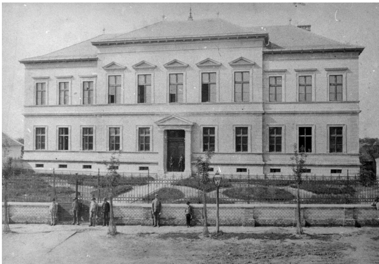
3. ábra A Horváth Mihály Gimnázium épülete 1888-ban